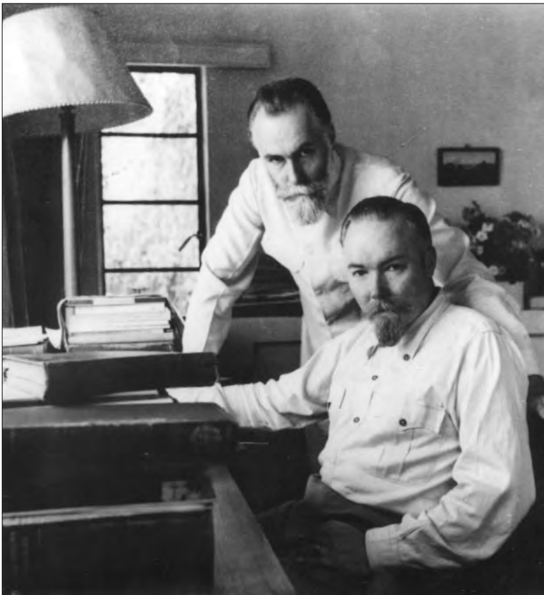
Святослав Николаевич и Юрий Николаевич Рерихи. 1955 г.