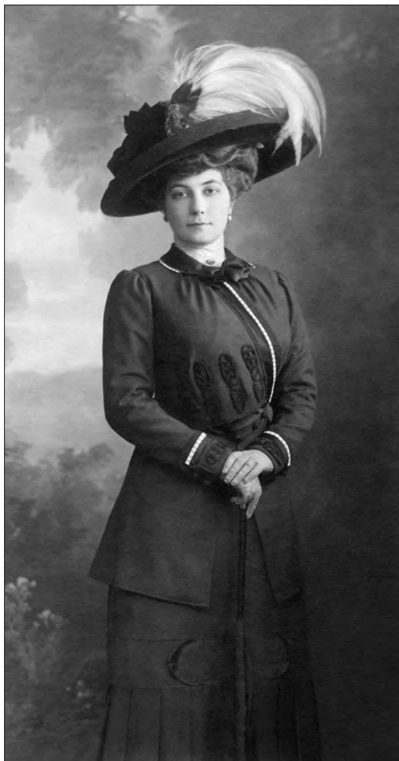
Елена Ивановна Рерих 1915–1916 гг.