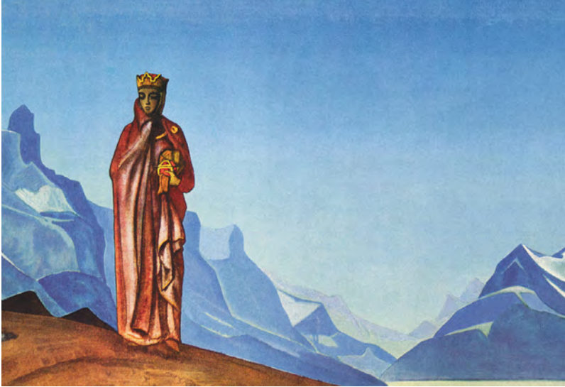
Н.К. Рерих. Держательница Мира (Камень несущая). 1933 г.