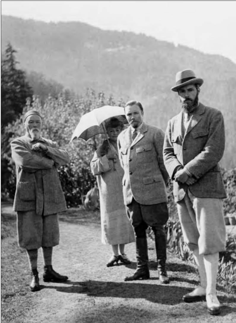
Николай Константинович, Елена Ивановна, Юрий Николаевич, Святослав Николаевич Рерихи в Кулу. 1932–1933 гг.