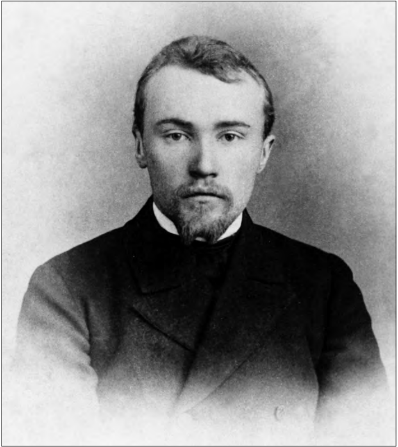
Николай Константинович Рерих 1890-е гг.