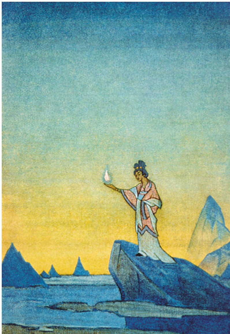
Н.К. Рерих. Агни Йога. 1928 г.