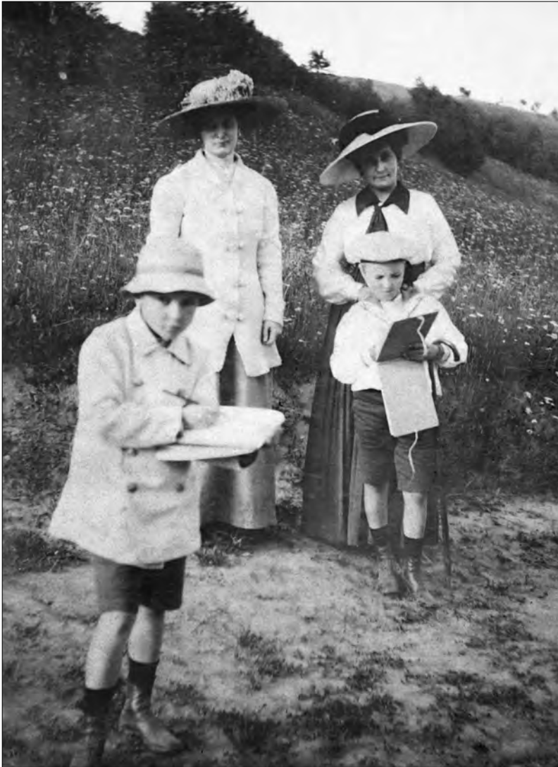
Елена Ивановна Рерих с сыновьями и гувернанткой. 1913 г.