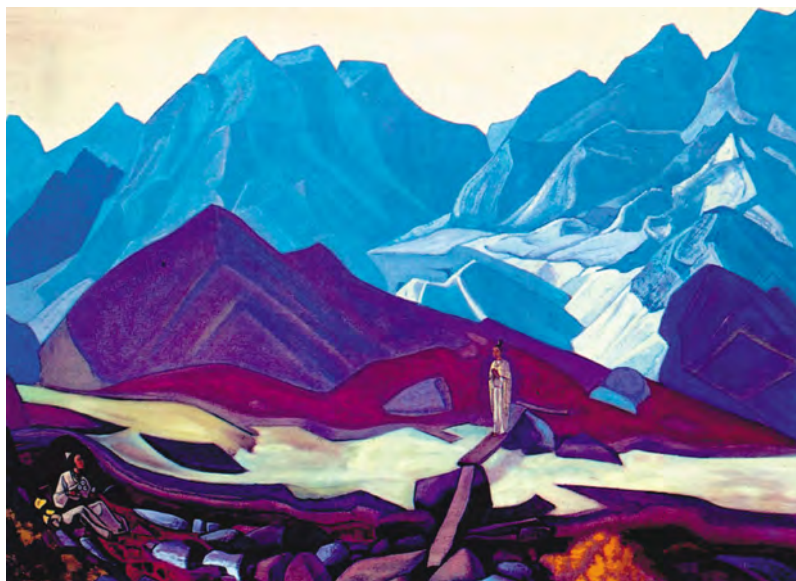
Н.К. Перух. Омтыда. 1935–1936 гг.