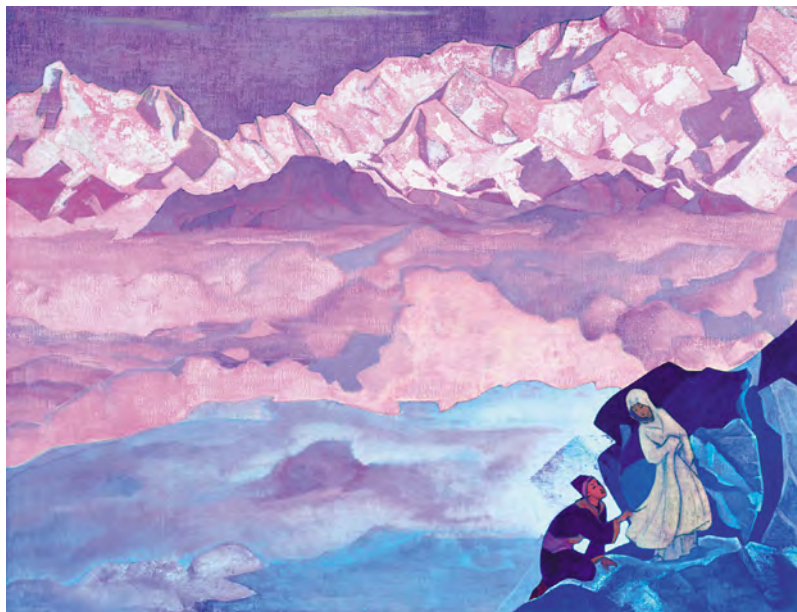
Н.К. Рерих. Ведущая. 1924 г.